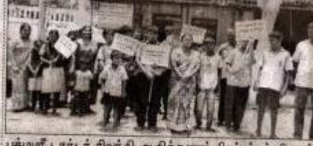
பத்மஸ்ரீ டாக்டர் சிவந்தி ஆதித்தனார் சிறப்புப்பள்ளி சார்