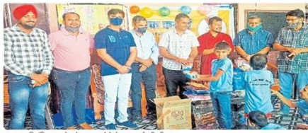
अलवर, विमर्दित बच्चों को उपहार देने नेक कमाई की टीम।