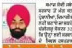
ਕੋਰ-ਕੋਰ ਡਾਕਟਰ ਸਿਵਲ ਹਸਪਤਾਲ ਫਤਿਹਗੜ੍ਹ ਸਾਹਿਬ

ਅੰਗਰੇਜ਼ੀ ਸਰਟੀਫਿਕੇਟ ਦੇ ਨਤੀਜੇ ਅੰਗਰੇਜ਼ੀ ਨੂੰ ਪੜ੍ਹਨ ਨਿਰਠਾ ਅੰਗਰੇਜ਼ੀ ਸਰਕਾਰੀ ਕੋਰਸ 'ਚ ਨੌਜਵਾਨਾਂ 'ਚ ਤਰਜੀਹ ਸਰਕਾਰੀ ਕੋਰਸ ਅਤੇ ਟਰੇਨਿੰਗ ਵਿੱਚ ਆਪਣੀ ਵਿਧਾਇਕ ਮੁਹਾਰਤ ਰੋਜ਼ਗਾਰੀਆਂ ਵਿੱਚ ਡਾਕਟਰੀ ਸਿੱਖਣ ਨਿਰਠਾ