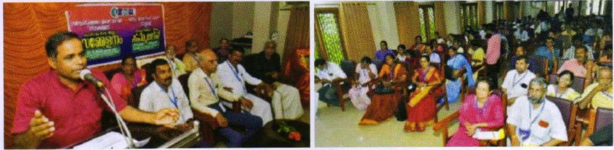
केरल - कासरगोड जिला