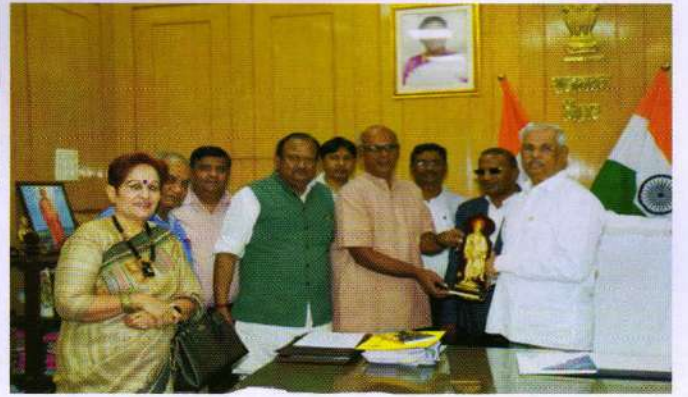
SAKSHAM Savita Team with the Hon'ble Governor of Tamil Nadu Shri R.N.Ravi