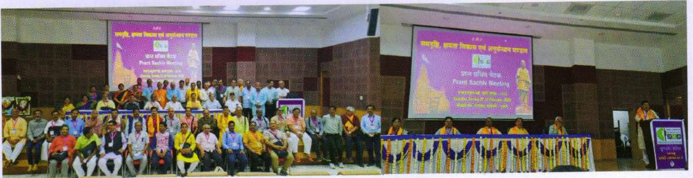
प्रान्त सचिव बैठक, अहमदाबाद

सक्षम दिल्ली, कानपुर, भाग्यनगर, जबलपुर जैसे स्थानों पर सचल एंबुलेंस वाहन के द्वारा नेत्र जांच इत्यादि पहले से ही किया जा रहा है और नेत्रदान भी कराया जा रहा है। इस वर्ष सक्षम द्वारा सेवा यु.एस.ए. के आर्थिक सहायता से क्यॉझर उड़ीसा, डिब्रुगढ़ असम, जबलपुर महाकौशल एवं रियासी जम्मू प्रांत में एंबुलेंस सेवा प्रारंभ की गई है। इसके माध्यम से आसपास के क्षेत्रों से नेत्रों की जांच करके उनको उनके निवास स्थान पर ही चिकित्सा की सुविधा उपलब्ध करा रहा है साथ में आवश्यकता पड़ने पर कार्यकर्ता द्वारा संचालित नेत्र चिकित्सालय में सुविधा प्रदान करना शुरू किया है।