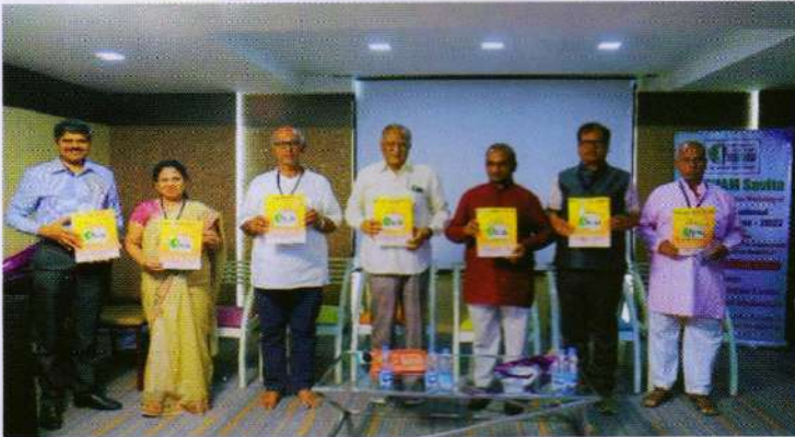
Release of Souvenir during SAKSHAM Savita Preconference Workshop of ILC-2022

As a prelude to 21st ILC-2022, SAKSHAM Savita conducted a 2 days Pre-conference Workshop on "Basics of Leprosy: Challenges and Solutions" for Volunteers and Voluntary Organizations serving LCDPs on 7th and 8th November, 2022. The goal of workshop is to build the capacity and network the expertise across the nation to address the multifaceted challenges of leprosy by providing country specific solutions. More particularly, the workshop is aimed to implement Community based rehabilitation (CBR) through training volunteers and voluntary organizations and to support Government to implement effective rehabilitative measures benefitting LCDPs. Sessions on basic facts about leprosy, socio-economical, medical, rehabilitative and legal challenges and how to overcome these challenges by solutions were deliberated in the workshop through interactive sessions between delegates and experts.