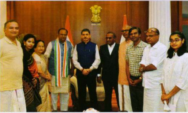
SAKSHAM Savita team with the Hon'ble Governor of Bihar Shri. Rajendra Viswanath Arlekar Ji

Team SAKSHAM was invited by the Hon'ble Governor of Bihar Shri. Rajendra Vishwanath Arlekar to discuss about the legal burden of leprosy and possible implementation of CBR in Bihar state. A proposal has been submitted to him in this regard.