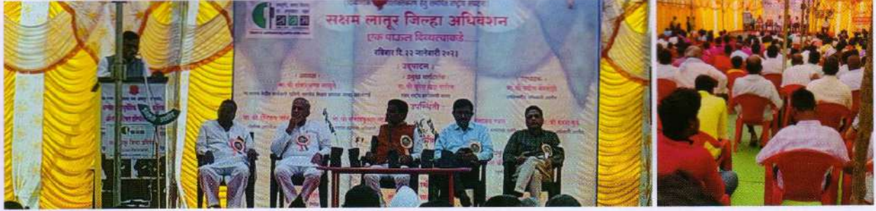
देवगिरी - लालपुर जिला

संगठन ने इस वर्ष जिला स्तर अधिवेशन की योजना बनाई थी। देशभर के कार्यकर्ताओं के अथक प्रयास से इस वर्ष 225 जिलों में दिव्यांगों के साथ सामान्य लोगों के सहयोग से एक दिवसीय जिला अधिवेशन सम्पन्न हुए, जिसके कारण जिला स्तर पर जिला कार्यकारिणी एवं सदस्यों की सक्रियता बढ़ी। जिले के निचले स्तर ब्लॉक एवं तहसील के साथ-साथ गाँव तक संगठन पहुँचने में सफल रहा। इन कार्यक्रमों में अधिक मात्रा में दिव्यांग बन्धुओं तथा महिलाओं ने सहभाग किया। तमिलनाडु, केरल, उत्तराखण्ड आदि प्रान्तों में अधिक संख्या में जिला अधिवेशन सम्पन्न हुए। यह संगठन के दृढ़ीकरण का अलग रूप सिद्ध हुआ।