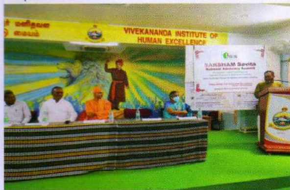
Shri. G.R.Swaminathan, Hon'ble Justice, High Court of Madras addressing the Summit