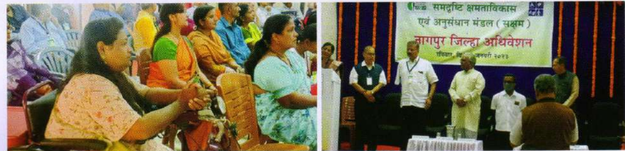
विदर्भ - नागपुर जिला