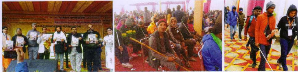
दिल्ली - उत्तरी विभाग