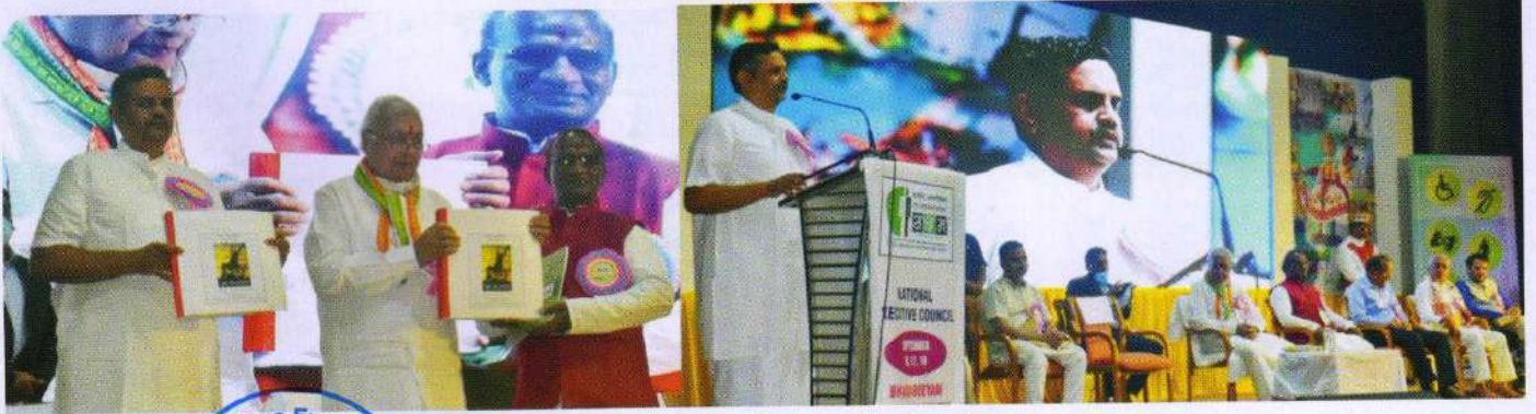
राष्ट्रीय कार्यकारी परिषद, कोच्ची, केरल