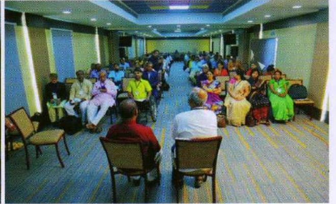
Participants of Preconference Workshop of ILC-2022