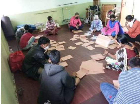
Garounda Project At Nadi Hattarga Activities

देशात अनेक प्रश्न असून भैय्याजी जोशी यांनी देशात अनेक प्रश्न असून भैय्याजी जोशी यांनी