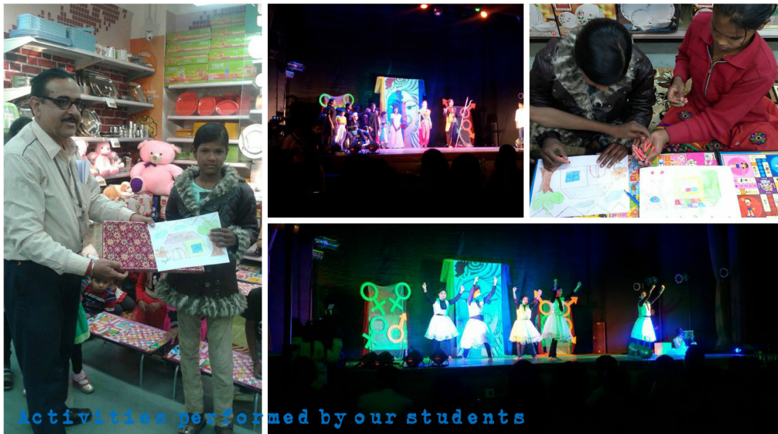
Activities performed by our students