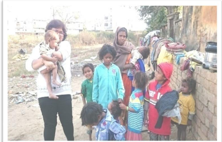
HEALTH AWARENESS GUIDENCE IN ROAD SIDE FAMILY

दिनांक 26.10.2018 को सड़क किनारे रहने वाले घूमंतु परिवार के हित में कार्यक्रम का आयोजन किया गया। इस आयोजन में सुखे भोजन , गर्म वस्त्र का वितरण किया गया साथ ही सर्दियों में होने वाली बिमारीयों के बारे में जागरूक किया गया।