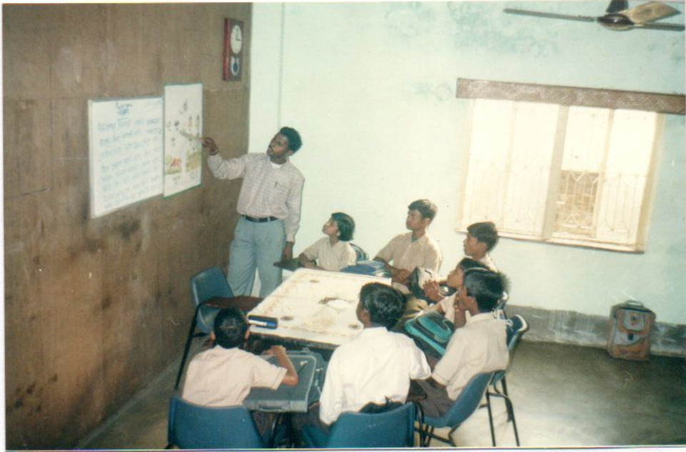
THE PHOTOGRAPH – A VIEW OF SPECIAL SCHOOL (CLASS ROOM). FOR MENTALLY CHALLENGED.