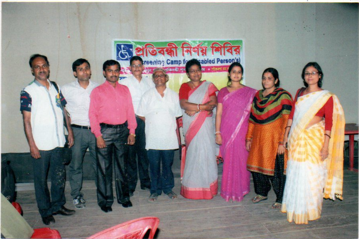
THE PHOTOGRAPH – A VIEW OF STAFF AND HEALTH PERSONAL WHO ARE ENGAGED SPECIAL SCHOOL AND SCREEN CAMP.