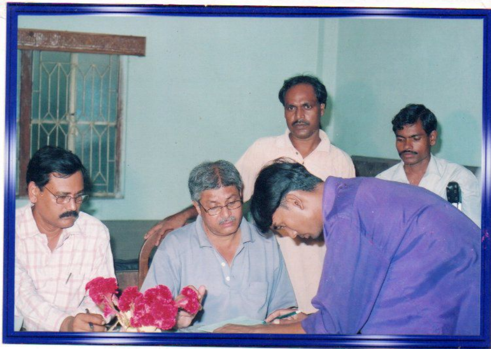
THE PHOTOGRAPH – A VIEW OF SPECIAL EMPLOYMENT REGISTRATION CAMP FOR C.P/M.D