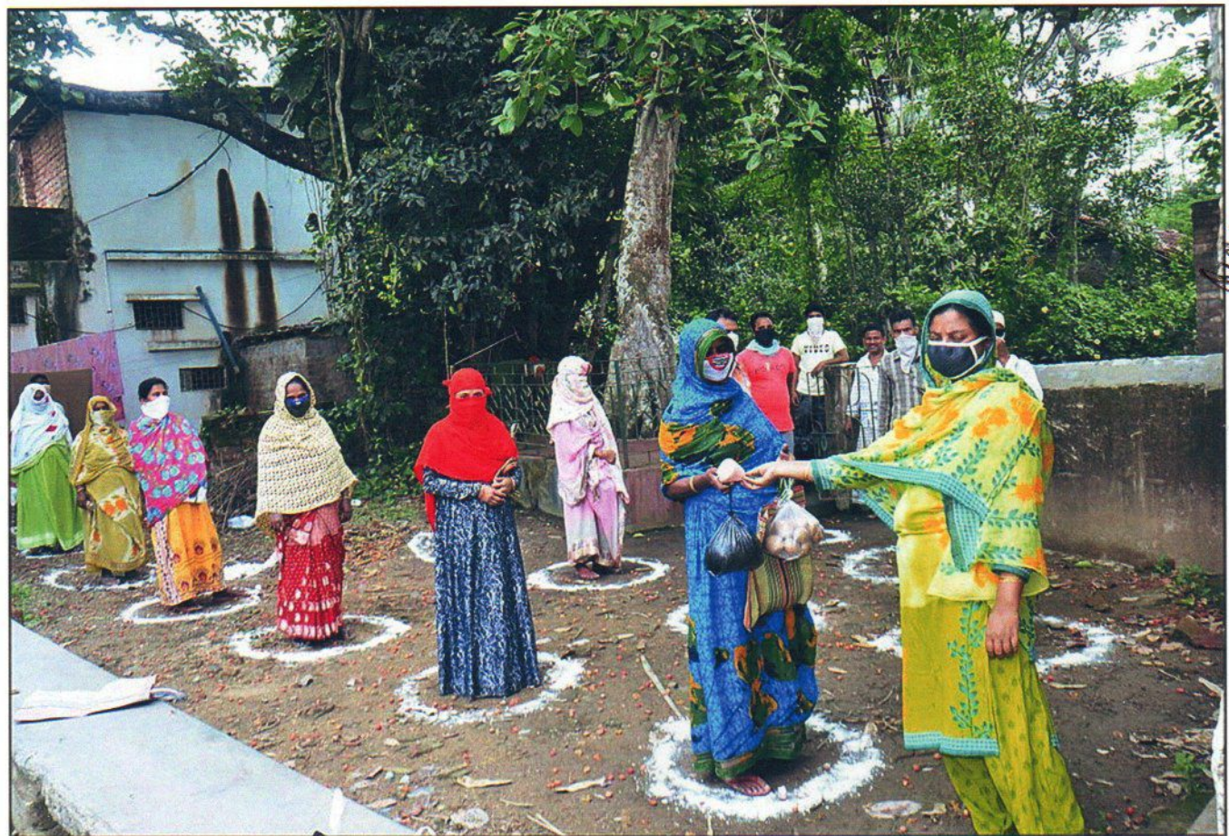
THE PHOTOGRAPH – A VIEW OF DISTRIBUTION FOODS AND MASKS.

M. M. M. Secretary YUBA UNNAYAN SEBA SAMITY