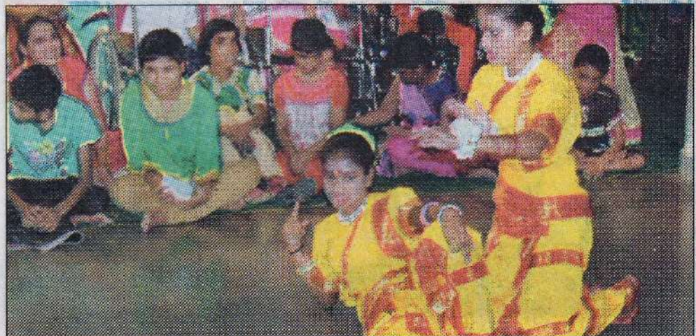
Divyang children giving performance at SOS Village.

The school focuses on the holistic development of every child. The school in Bhopal is well facilitated with interactive classrooms, libraries and computer rooms in order to provide children exposure in the best possi-