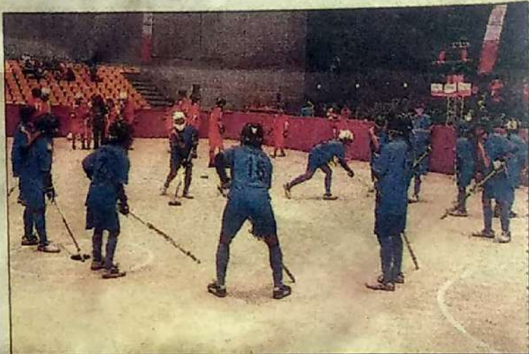
फ्लोर हॉकी मैच के पूर्व अभ्यास करती भारतीय महिला टीम।