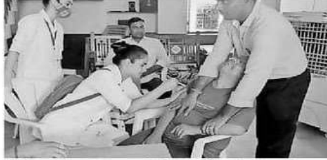
आहोर. मानसिक विमंदित बच्चों के टीकाकरण करते नर्सिंग कर्मी।

धुबडिया उपखंड क्षेत्र के रंगला गांव में स्थित राजकीय