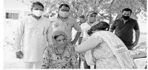
धुबडिया. टीका लगवाते ग्रामीण।