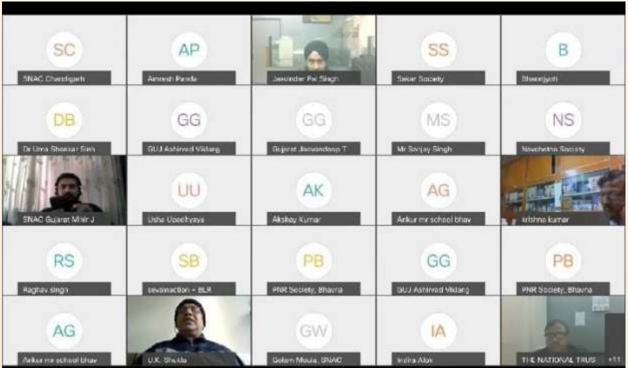
अछूते जिलों में गैर सरकारी संगठनों को बढ़ावा देने के लिए उप-समिति की बैठक के प्रतिभागी

अंडमान और निकोबार, अरुणाचल प्रदेश, चंडीगढ़, दादर और नगर हवेली और दमन और दीव, लक्षद्वीप, मेघालय, पुडुचेरी, सिक्किम, त्रिपुरा, मिजोरम, नागालैंड, जम्मू और कश्मीर, लद्दाख जैसे अछूते राज्यों/संघ राज्य क्षेत्रों में, गैर-सरकारी संगठनों को राष्ट्रीय न्यास में पंजीकरण करने हेतु बढ़ावा देने के लिए कार्यनीति बनाने हेतु बोर्ड के सदस्यों की उप-समिति की 16 दिसंबर, 2021 को आभासी बैठक हुई। बैठक में सभी बोर्ड सदस्यों, राज्य नोडल एजेंसी केंद्रों (SNAC) और कुछ सरकारी अधिकारियों ने भाग लिया।