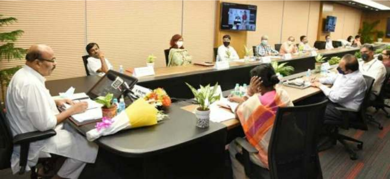
दिनांक 7 अगस्त 2021 को माननीय मंत्री, सामाजिक न्याय और अधिकारिता द्वारा डिजिटल बेस्ट प्रैक्टिसेस पर राष्ट्रीय कान्फ्रेंस एवं नार्थ ईस्ट समिट को संबोधित करते हुए

राष्ट्रीय न्यास ने 7 अगस्त, 2021 को बौद्धिक और विकासात्मक दिव्यांगजन व्यक्तियों के लिए 'राष्ट्रीय डिजिटल सर्वोत्तम प्रथाएँ और उत्तर-पूर्व शिखर सम्मेलन' का आयोजन किया। अपनी तरह के पहले इस शिखर सम्मेलन